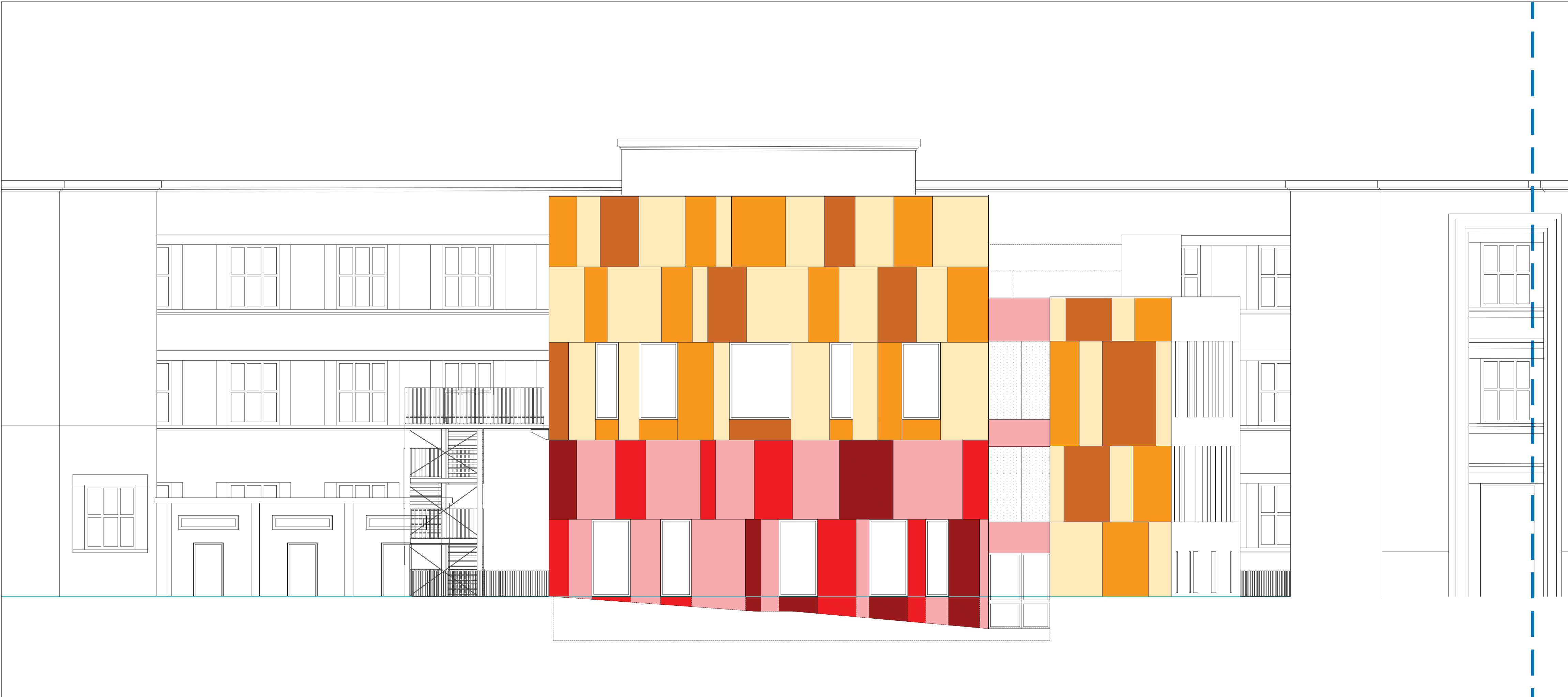
04 SEZIONE 3 - PROSPETTO SUD - PALESTRA scala 1:100