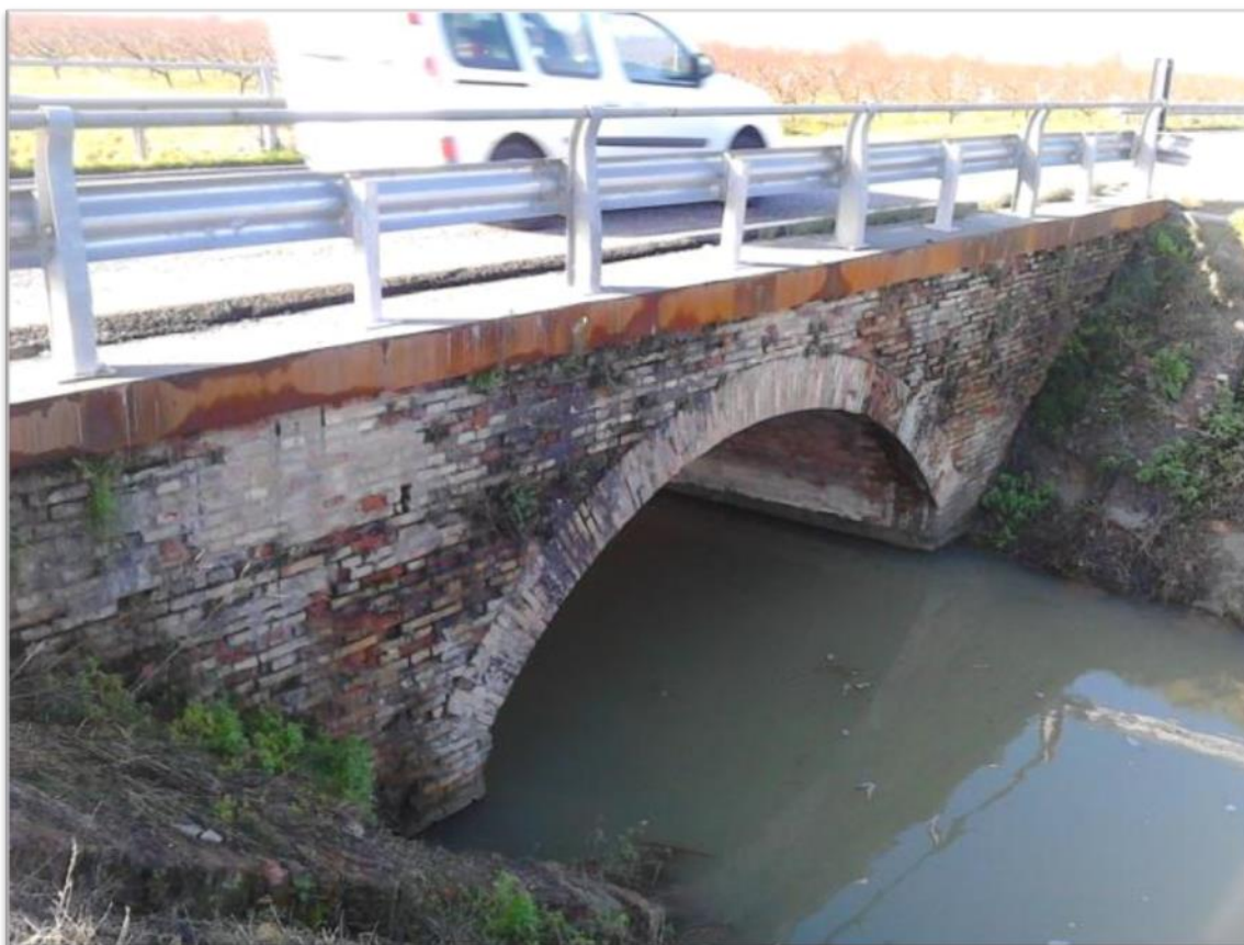
Foto 1 - immagine del ponte sullo scolo via Cupa - pre-alluvione