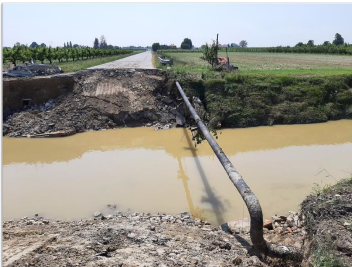
Foto 2 - Immagine del relitto ponte sullo scolo via Cupa - post-alluvione