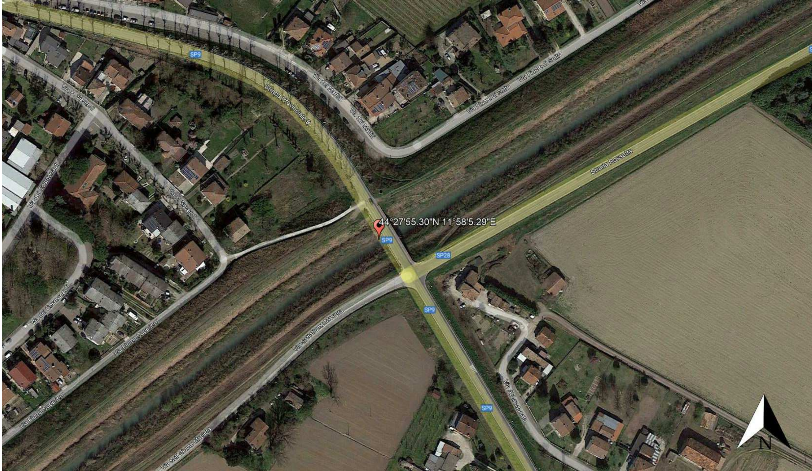
Geolocalizzazione con Ortofoto