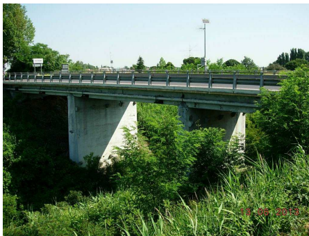
Progetto Definitivo - Esecutivo

D.M. 49/2018 - INTERVENTO DI MANUTENZIONE STRAORDINARIA DEL PONTE MASIERA SUL FIUME SENIO AL KM 5+274 DELLA S.P.9 MASIERA CUP J33D18000100001