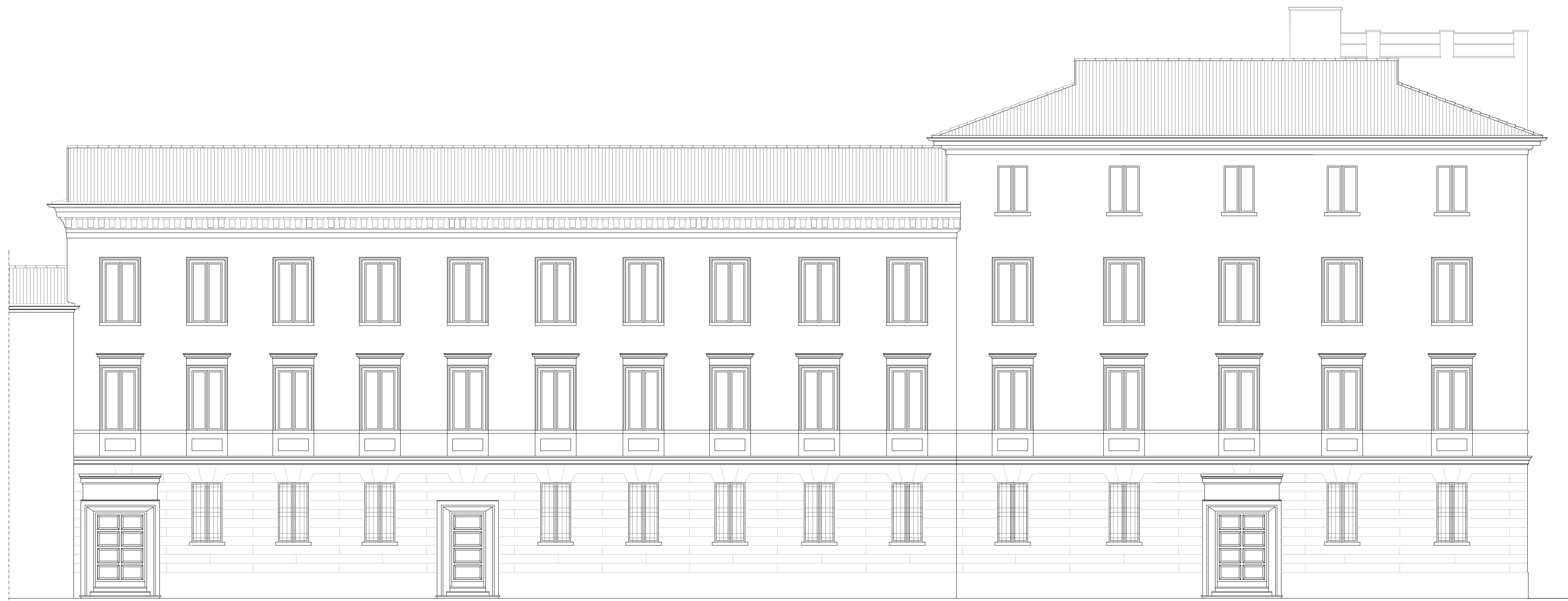
PROSPETTO SU VIA BARACCA