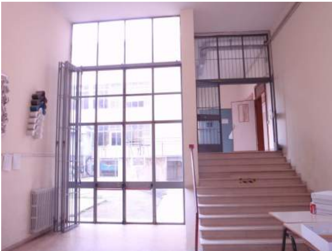
Piano terra-ingresso da Via S. Nevolone