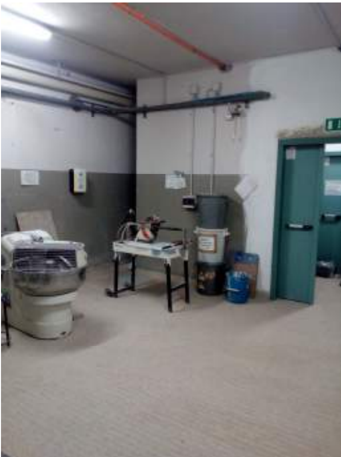
Piano seminterrato- locale forni, ascensore A001 corridoio, deposito ceramico-