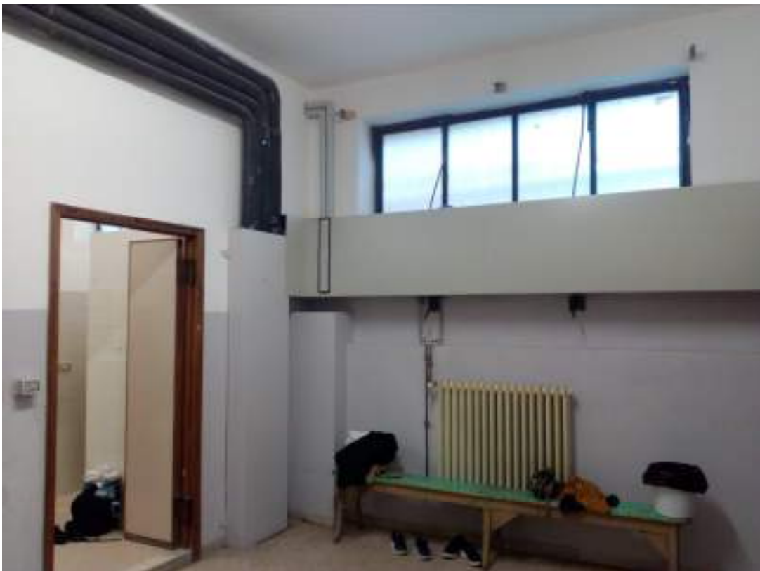
Piano ammezzato- zona spogliatoio palestra