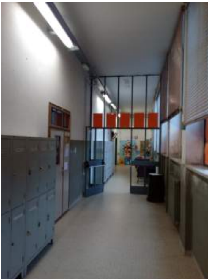
Piano primo -disimpegno