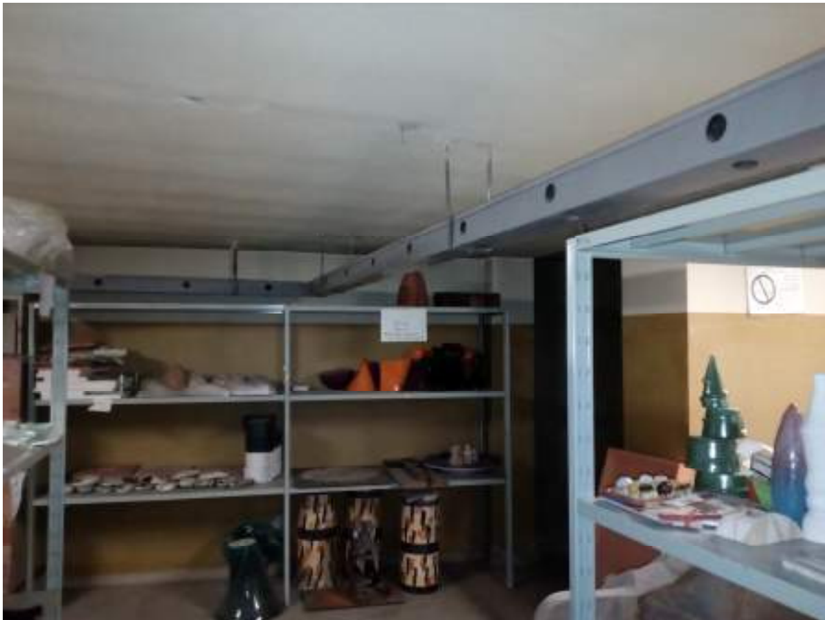
Piano seminterrato -magazzino ceramiche