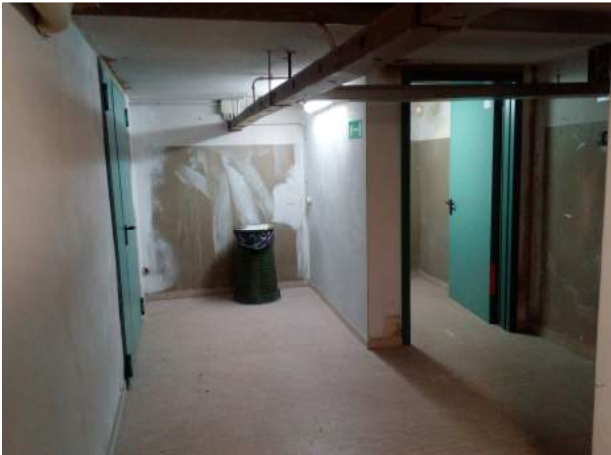
Piano seminterrato - zona filtro ascensore A003