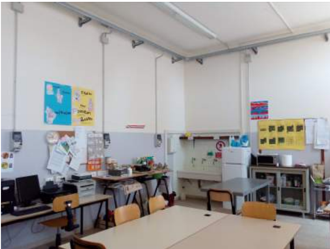
Piano primo- aule