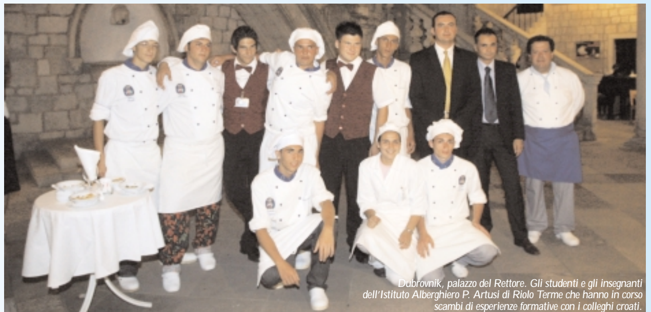
Dubrovnik, palazzo del Rettore. Gli studenti e gli insegnanti dell'Istituto Alberghiero P. Artusi di Riolo Terme che hanno in corso scambi di esperienze formative con i colleghi croati.