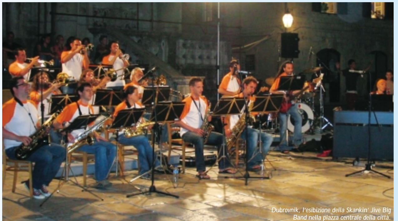
Dubrovnik, l'esibizione della Skankin' Jive Big Band nella piazza centrale della città.

A Dubrovnik si è svolta, infine, anche la finale europea di Enterprise - il gioco di simulazione di creazione d'impresa, gestito da Ecipar Cna, a cui hanno partecipato ragazzi degli istituti di II grado della provincia di Ravenna.