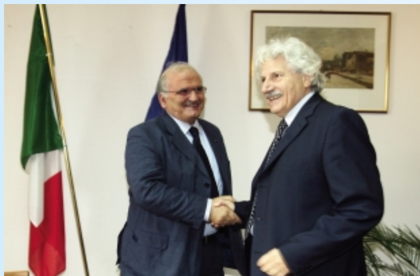
Giangrandi con Alessandro Fallavollita, ambasciatore d'Italia a Sarajevo.

Erano presenti all'incontro con Fallavollita, concordato con la Camera di Commercio Italo-Bosniaca, rappresentata da Goran Vujasin, anche imprenditori ravennati - Lara s.a.s., Emme Hotels, Associazione Panificatori, Delta 2000 - interessati ad avviare in Bosnia progetti relativi alla distribuzione di alimenti per strutture alberghiere, per prodotti alimentari da forno e ricerca di manodopera del settore e, infine, per la gestione e valorizzazione di parchi e aree ambientali.